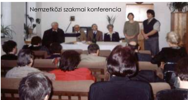
Nemzetközi szakmai konferencia