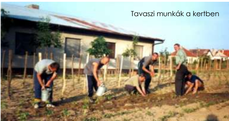
Tavaszi munkák a kertben