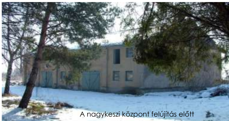
A nagykeszi központ felújítás előtt