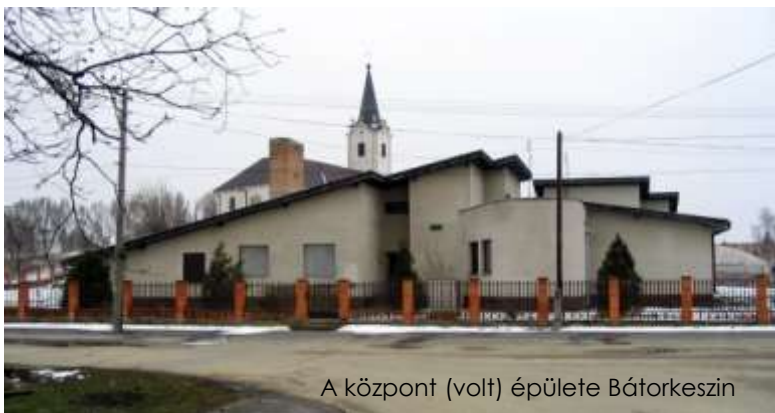
A központ (volt) épülete Bátorkeszin