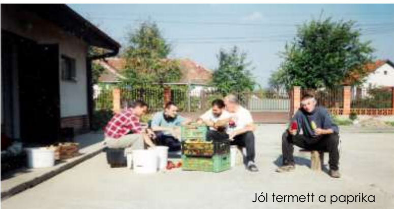
Jól termett a paprika