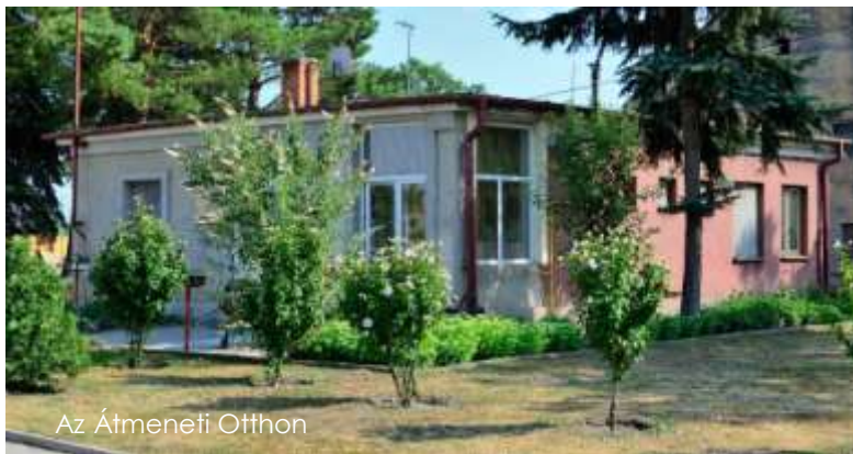
Az Átmeneti Otthon