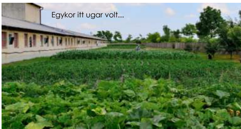
Egykor itt ugar volt...