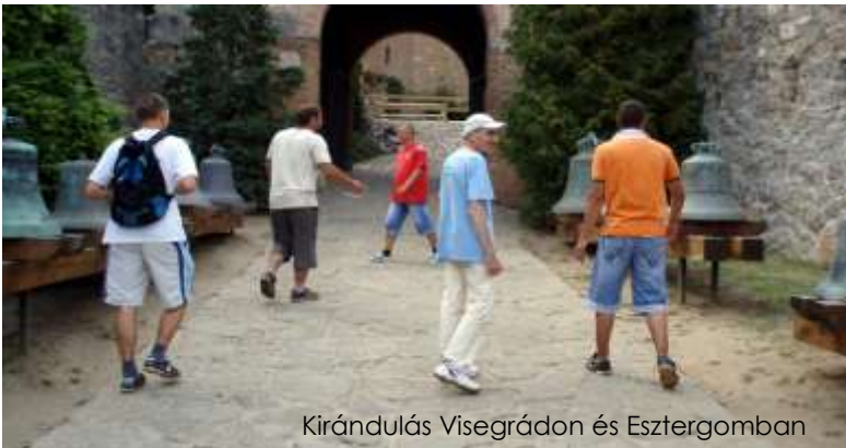
Kirándulás Visegrádon és Esztergomban