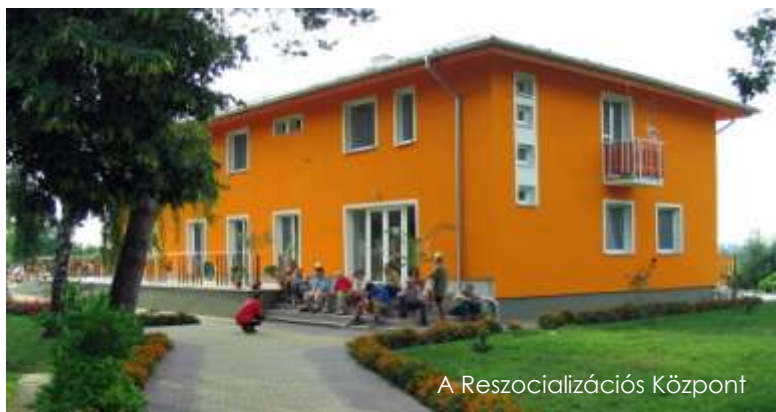
A Reszocializációs Központ